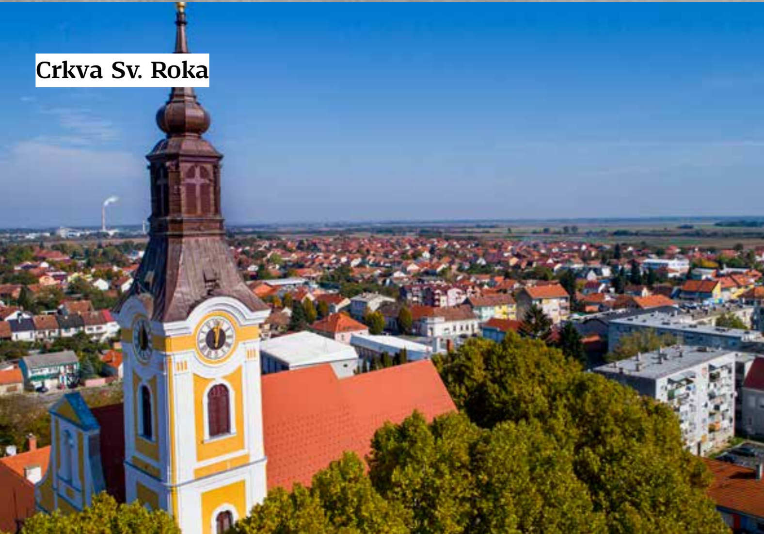
Crkva Sv. Roka