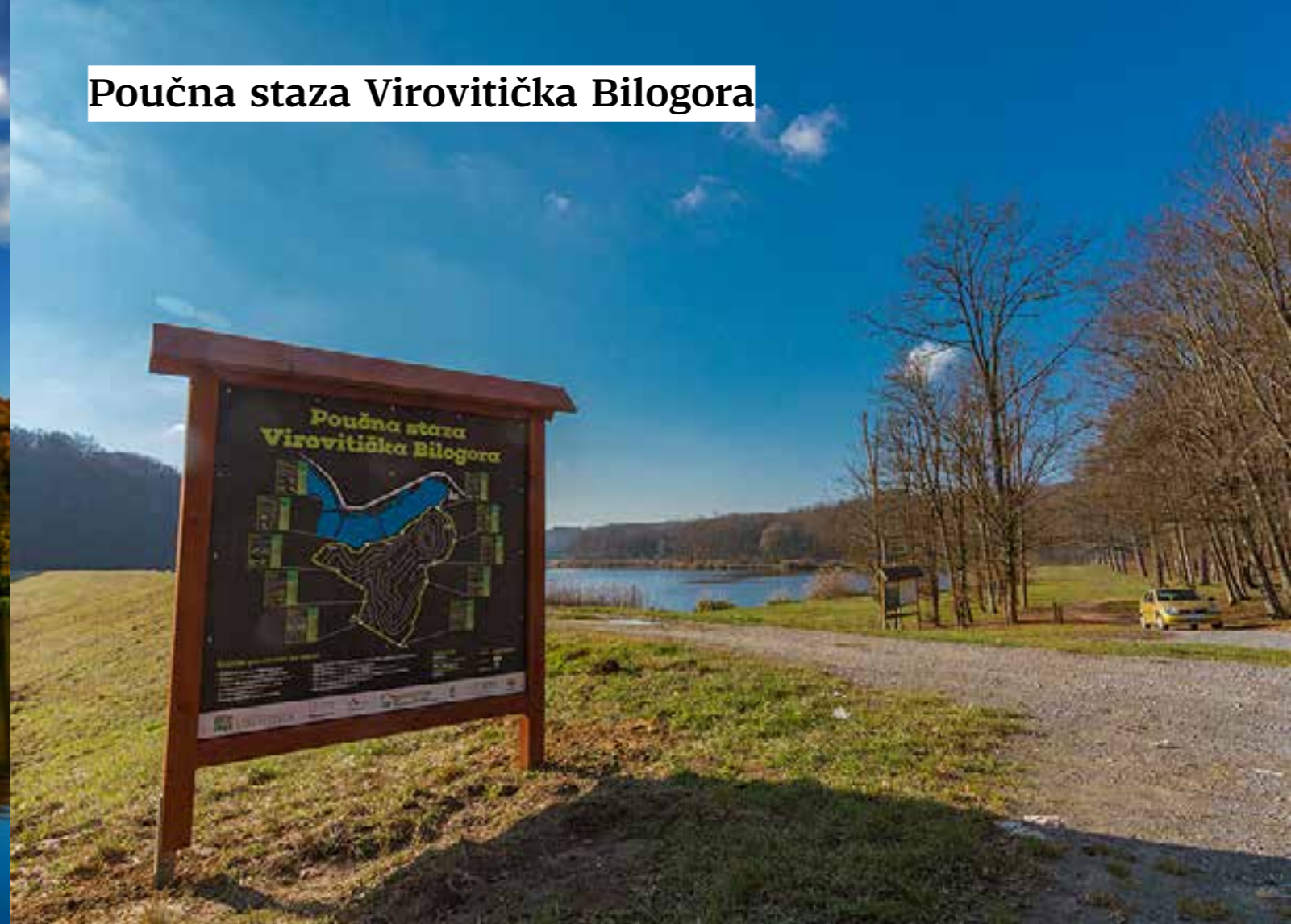
Poučna staza Virovitička Bilogora