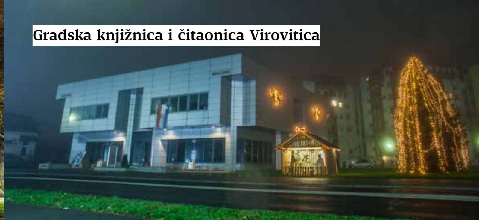
Gradska knjižnica i čitaonica Virovitica