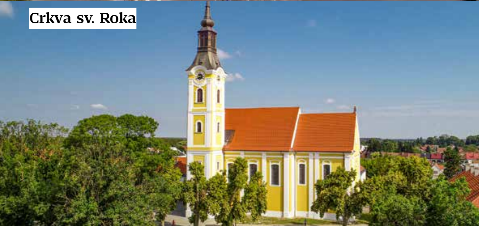
Crkva sv. Roka