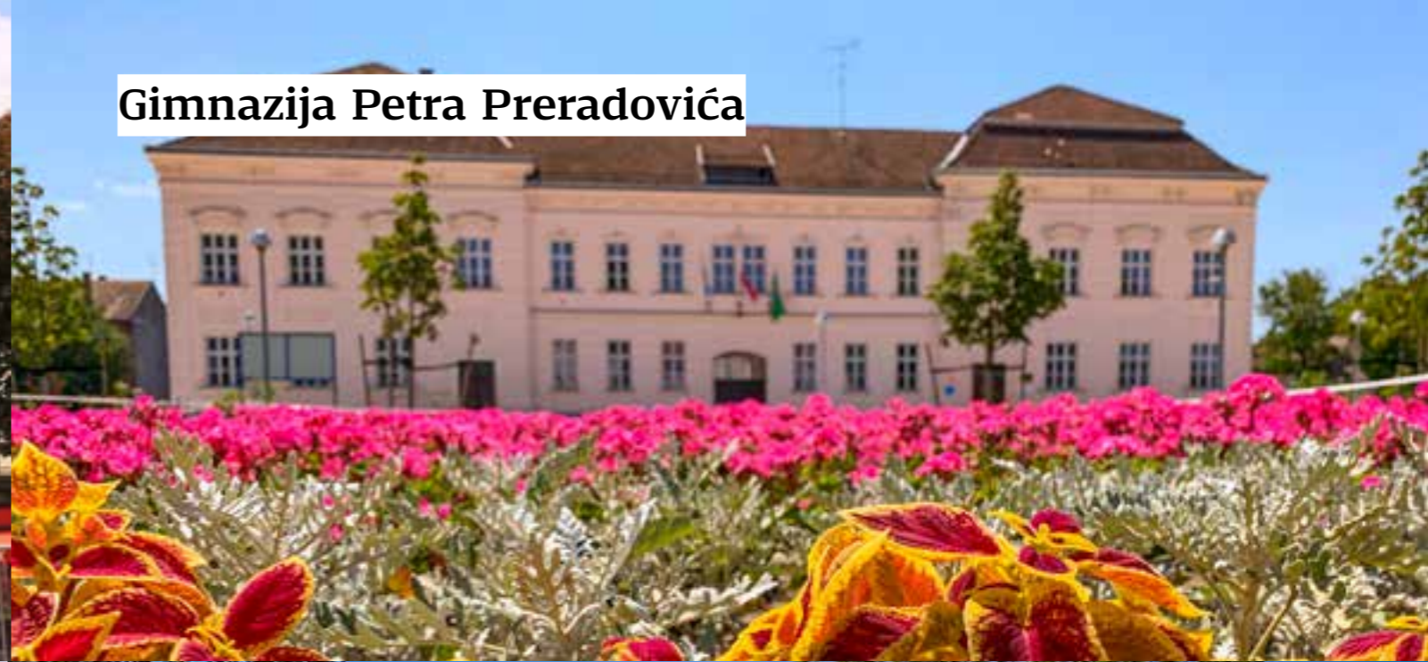
Gimnazija Petra Preradovića